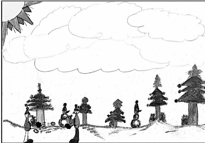
IL DISEGNO NATALIZIO È STATO REALIZZATO DA ALBERTO CUCCO E GIUSEPPE POERIO